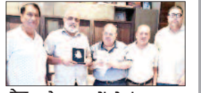
पेज 06 वैष्णव भक्तों को भंडारा रिवलाने से बदलती हैं...