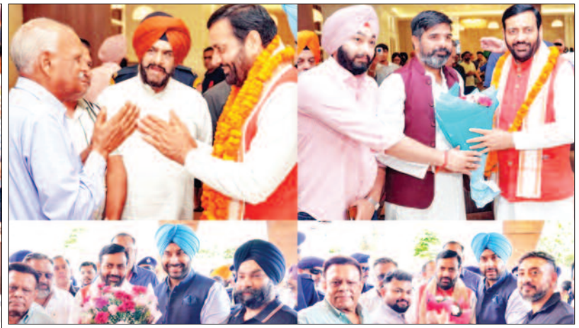
समारोह में पहुंचे सीएम नायब सैनी व अन्य नेता