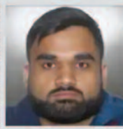
गैंगस्टर गोल्डी बराड़ नॉर्थ अमेरिका