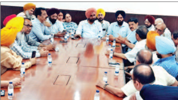
इंडस्ट्री बंद होने की कगार पर पहुंची

लुधियाना/यूटर्न/6 जुलाई। पंजाब सरकार की और से दावा किया जा रहा है कि उनकी तरफ से खेतों और घरों तक 85 प्रतिशत तक नहरी पानी पहुंचा दिया है। यह पानी पूरे राज्य में पहुंचाने के दावे हैं। लेकिन लोगों में चर्चा है कि अगर नहरी पानी घरों और खेतों तक पहुंच गया है तो फिर बिजली कट क्यों लग रहे हैं। इससे तो बिजली कटौती होनी चाहिए थी। लेकिन उसके उल्ट कट ज्यादा लगने शुरू हो गए। जिससे इंडस्ट्री को पर्याप्त बिजली सप्लाई नहीं मिल पा रही और इंडस्ट्री परेशान हो चुकी है। यहां तक कि लुधियाना कि अलग अलग इंडस्ट्रियल यूनिटों के मालिकों द्वारा पिछले दिनों पावरकॉम चीफ इंजीनियर