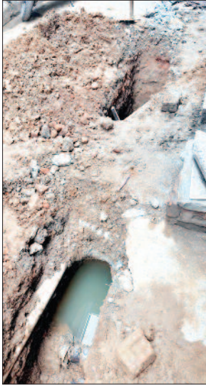
विश्वकर्मा कॉलोनी में काम अधूरा छोड़कर गए वर्कर

राजदीप सिंह सैनी लुधियाना/यूटर्न/6 जुलाई। लुधियाना में नहरी पानी घरों तक पहुंचाने के लिए पाइपलाइन बिछाई को वर्ल्ड बैंक की और से अकेले लुधियाना को साढ़े 1400 करोड़ रुपए दिए हैं। इस प्रोजेक्ट के तहत हल्का साउथ के वार्ड 31 में पड़ते ढोलेवाल की विश्वकर्मा कॉलोनी में भी पाइपें बिछाई जा रही है। निगम से पेमेंट मिलने के बावजूद ठेकेदारों के वर्कर्स द्वारा कनेक्शन करने के नाम पर हर घर से 6000 रुपए तक की अवैध वसूली की जा रही है। इसका खुलासा होने के बाद ठेकेदार के वर्कर अपना बचाव करते हुए काम बीच में ही बंद करके चलते बने। गली नंबर 13 बुरी तरह से तोड़ रखी है, इलाका निवासियों को घरों से बाहर निकलना मुश्किल हो गया है। चर्चा है कि अवैध वसूली का पता चलने पर ठेकेदार ने काम रोक दिया, ताकि जनता परेशान हो और निगम पर दबाव पड़े। जिसके बाद वे बेकसुर साबित हो जाए। इस अवैध वसूली के सबूत मिलने के बावजूद