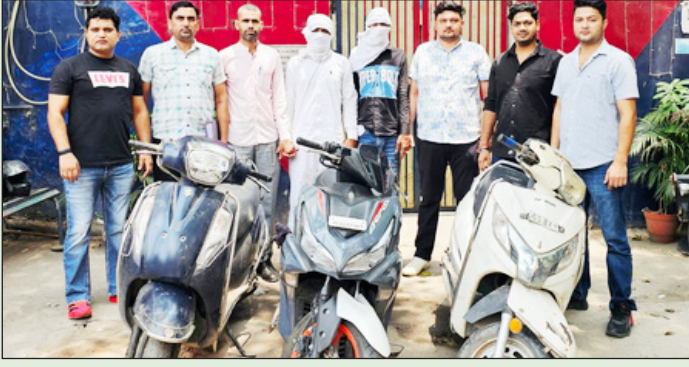
सूचना मिली थी कि दो संदिग्ध चोरी की स्कूटी से इलाके में आने वाले हैं। सूचना के आधार

पुलिस ने उनके कब्जे से तीन चोरी के दोपहिया वाहन बरामद किए हैं। पुलिस के अनुसार, इस कार्रवाई से मोटर वाहन चोरी के कई मामलों का खुलासा हुआ है। पुलिस के अनुसार, 2 जुलाई को एटीएस की टीम को