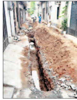
विश्वकर्मा कॉलोनी में तोड़ी गई सड़क

वर्ल्ड बैंक निगम को अदा कर रहा हर चीज का पैसा