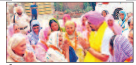
पेज 06 भद्रालुओं के चेहरों पर दिखी खुशी, तीर्थ यात्रा के...