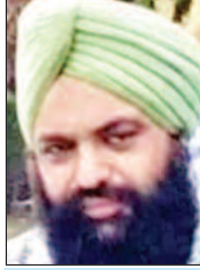
उपाध्यक्ष वीरेंद्र सिंह (कांग्रेस)