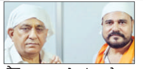
पेज 06 पत्रकार लोकतंत्र का चौथा स्तंभ, जनहित के मुद्दे...