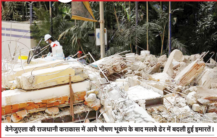
वेनेजुएला की राजधानी कराकास में आये भीषण भूकंप के बाद मलबे ढेर में बदली हुई इमारतें।