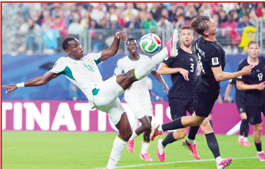
न्यूजीलैंड में नार्वे और सेनेगल के बीच हुए फीफा विश्वकप फुटबॉल मैच में सेनेगल के निकोलस जेकसन गोल दागते हुए।