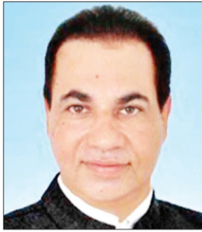
प्रतिपक्ष राहुल गांधी के कोटा में छात्रों को संबोधित करने वाले कार्यक्रम का प्रसारण किया गया।