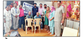
पेज 06 मनीमाजरा में निःशुल्क स्वास्थ्य जांच शिविर...