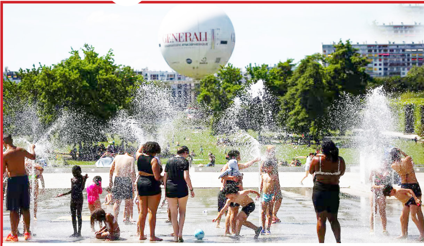
फ्रांस की राजधानी पेरिस में बढ़ती गरमी से राहत पाने के लिए फव्वारे के पानी से नहाते हुए लोग।