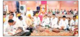
पेज 06 श्री सिद्ध पीठ श्री दंडी स्वामी मंदिर में साप्ताहिक...