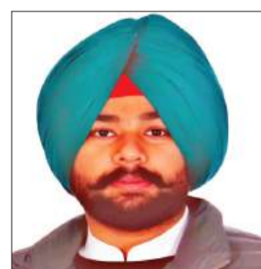
जीत को कांग्रेस के अंदर युवा नेतृत्व को आगे लाने की रणनीति