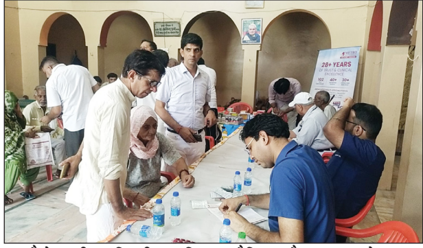
मैट्रो हास्पिटल दिल्ली द्वारा निशुल्क मेडिकल कैम्प का आयोजन

लाभ उठाया। कार्यक्रम का मुख्य आकर्षण आधुनिक तकनीक और प्रकृति का अद्भुत संगम रहा। योग सत्र के दौरान हवा में सभी साधकों के ऊपर लगातार ताजे फूलों की पुष्प वर्षा की गई। इसके साथ ही, पूरे माहौल को दिव्य बनाने के लिए गुलाब जल और गुलाब के इत्र की बारिश भी की गई।