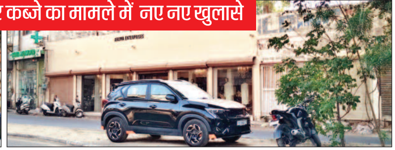
पखोवाल रोड की तरफ खुली दुकानें