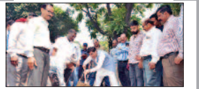
पेज 06 चंडीगढ़ में पहली बार वार्ड-वाइज मेगा डीप...