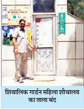
शिवालिक गार्डन महिला शौचालय का ताला बंद