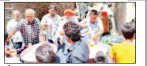
पेज 06 पुरुषोत्तम मास एकादशी पर प्राचीन हनुमान मंदिर...