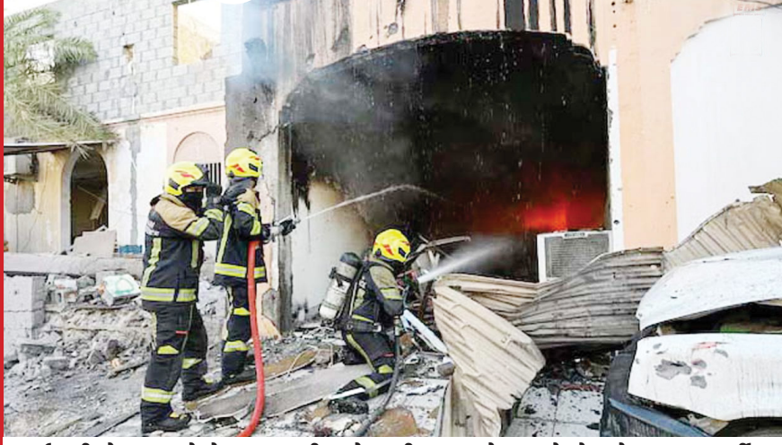
ईरानी ड्रोन हमलों के बाद बहरीन में लगी आग को बुझाने में जुटे दमकलकर्मी