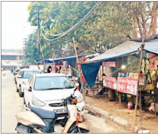
फिरोजगांधी मार्केट में फुटपाथ पर सजी दुकानें

लुधियाना/यूटर्न/6 जून। लुधियाना में रेहड़ी फड़ी वालों से करीब आठ करोड़ रुपए की अवैध वसूली करने की चचाओं ने तूल पकड़ना शुरू कर दिया है। यह मामला लगातार विवादों में घिरता जा रहा है। हर महीने इतनी बड़ी रकम का हेरफेर होने का पता चलने के बाद लोकल बाँडी विभाग, नगर निगम और जांच एजेंसियों के उच्च अधिकारियों में हड़कंप का माहौल है। अधिकारी भी हैरान हैं कि आखिर सरेआम इतना बड़ा झोल किया जा रहा था, लेकिन किसी को पता तक नहीं चल सका। हालांकि इस करोड़ों के हेरफेर में लुधियाना निगम के कई अधिकारी व हाउस लीडरों की भी मिलीभगत है। इसी के चलते हर महीने सरकारी खजाने में 10 से 15 लाख जमा होता है, जबकि 50 से 70 हजार रेहड़ियों से की जा रही करीब आठ करोड़ की वसूली की आपसी बंदरबांट हो रही है। वहीं शहरवासियों का कहना है कि मामले में विजिलेंस जांच होनी चाहिए, जिसमें बड़े खुलासे और कई बड़े चेहरों से पर्दे उठेंगे।