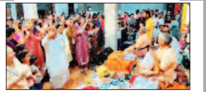
पेज 06 भ्रष्टा और भक्ति के साथ श्रीमद्भागवत कथा का ...