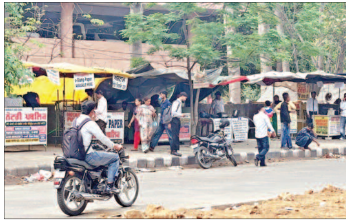
डीसी ऑफिस के बाहर फुटपाथ पर अवैध कब्जे

बात करें फिरोजगांधी मार्केट की तो वहां फुटपाथ पर सरेआम कब्जे किए हुए हैं। हालात यह हैं कि फुटपाथ पर रेहड़ी फड़ी खड़ी करके एक व्यक्ति द्वारा रोजाना 10 से 15 हजार रुपए की वसूली की जाती है। चर्चा है कि मार्केट में तहबाजारी टीम आती जरूर है, लेकिन 1-2 छोटी रेहड़ी फड़ी वालों को उठाकर खानापूति करती है। जबकि दूसरे दिन फिर रेहड़ियां लग जाती हैं।