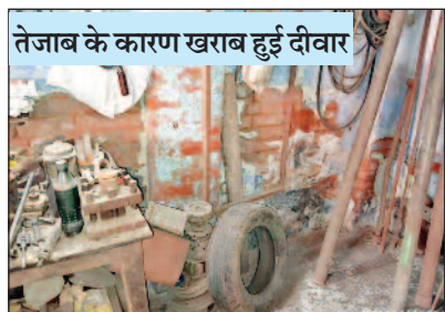
तेजाब के कारण खराब हुई दीवार

लुधियाना/यूटर्न/30 मई। गिल रोड स्थित दशमेश नगर की गली नंबर 12/7 में रिहायशी एरिया होने के बावजूद वहां सरेआम जिक प्लेटिंग का कारोबार चलाने के चलते इलाका निवासी बेहद परेशान हो चुके हैं। लोगों का आरोप है कि उन्होंने इस संबंध में सीएम से लेकर लुधियाना प्रदूषण कंट्रोल बोर्ड के चीफ इंजीनियर आरके रट्टा को शिकायतें की। तीन साल से शिकायतें करने के बावजूद आज तक एक्शन नहीं हुआ। अधिकारी आते हैं और