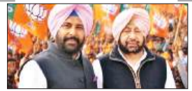
पेज 12 भाजपा का जदूदसिख बोदरों पर फोक्स, केवल दिल्ली...