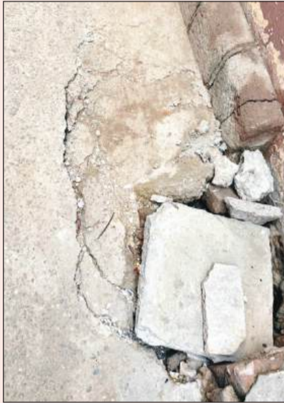
कई गलियाँ अंदर धसनी शुरू हो गई है।