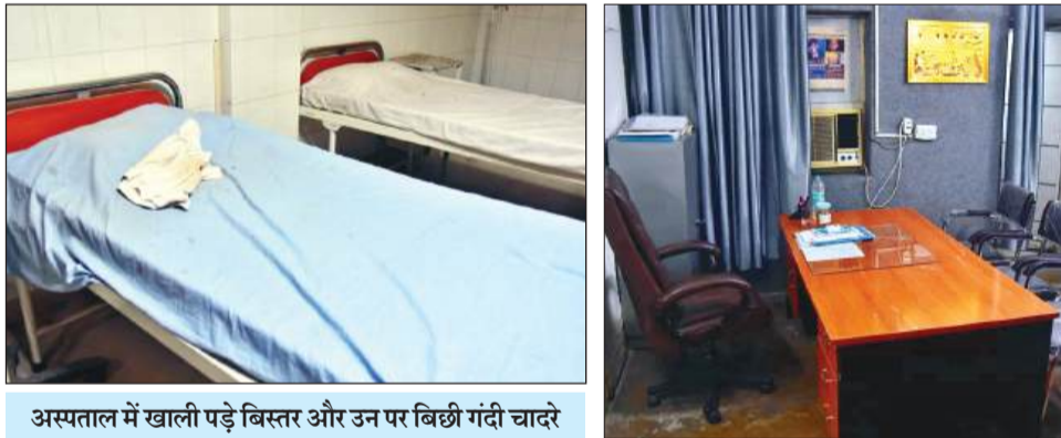
अस्पताल में खाली पड़े बिस्तर और उन पर बिछी गंदी चादरे

अधिकारियों के खाली पड़े दफ्तर जिसमें फूड ब्रांच के अलावा अन्य प्रोग्राम अफसर भी शामिल है