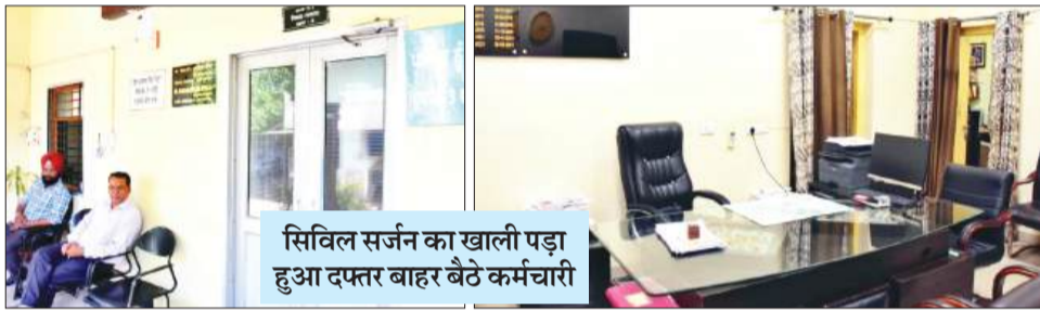
सिविल सर्जन का खाली पड़ा हुआ दफ्तर बाहर बैठे कर्मचारी