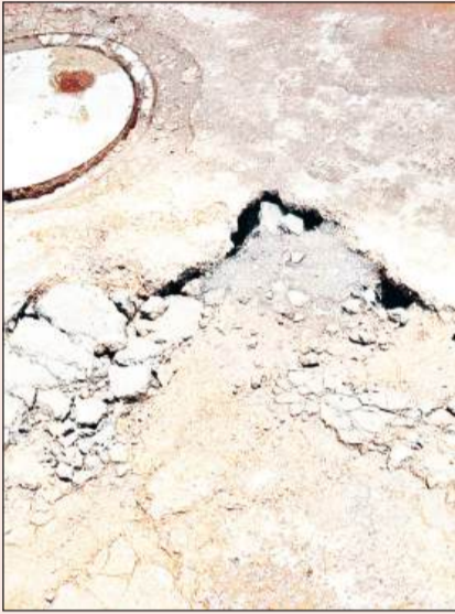
विश्वकर्मा कॉलोनी की गली नंबर 13 में चूहों ने अंदर से खोखली की सड़क