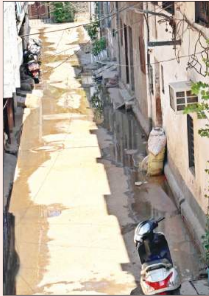
गलियों में भर रहता है सीवरेज का गंदा पानी

चुनाव के समय बड़े दावे, खत्म होते ही भूले