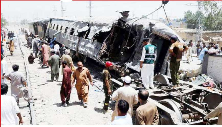
पाकिस्तान के क्वेटा में हुए धमाके में ध्वस्त रेलवे ट्रेक की मरम्मत करते हुए कर्मचारी।