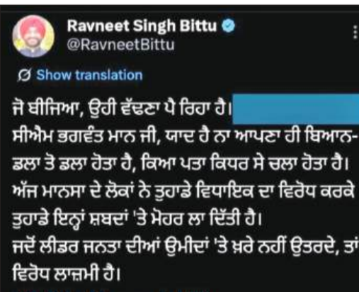
केंद्रीय राज्यमंत्री रवनीत सिंह बिट्टू द्वारा डाली गई पोस्ट

जानकारी के अनुसार, यह घटना मानसा में चल रही चुनाव प्रक्रिया के दौरान नामांकन पत्रों की छंटनी के समय हुई बहस और हंगामे से जुड़ी बताई जा रही है। वीडियो में विधायक कुछ कहते हुए भी नजर आते हैं, लेकिन सुरक्षा कर्मी उन्हें भीड़ से निकालकर गाड़ी में बैठाकर वहां से ले जाते दिखते हैं। इस घटना के बाद विपक्षी दलों ने इसे लेकर सरकार पर निशाना साधा है और सोशल मीडिया पर वीडियो को लगातार शेयर कर मुख्यमंत्री भगवंत मान को टैग किया जा रहा है।