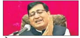
पेज 06 लुधियाना में श्री राम शरणम सत्संग: प्रार्थना और...