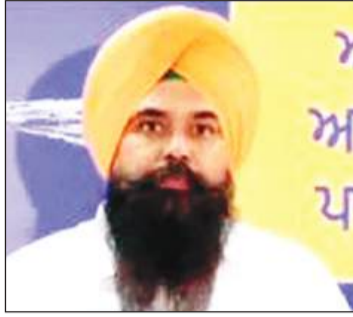
सत्यापन करवाना व्यावहारिक रूप से कठिन है।

का अहम हिस्सा है। कनाडा, ब्रिटेन, ऑस्ट्रेलिया, अमेरिका, इटली और खाड़ी देशों में बसे पंजाबी लगातार अपने गांवों और परिवारों से जुड़े रहते हैं। वे राज्य में निवेश करने के साथ-साथ परिवारों की आर्थिक मदद भी करते हैं। उन्होंने चुनाव आयोग को भेजे पत्र में कहा कि मतदाता सूची को पारदर्शी और त्रुटिहीन बनाना जरूरी है, लेकिन प्रक्रिया इतनी कठोर नहीं होनी चाहिए कि वास्तविक मतदाता ही अपने अधिकार से वंचित हो जाएं। विदेशों में रहने वाले लोगों के लिए कम समय में व्यक्तिगत रूप से उपस्थित होकर