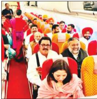
दिल्ली से लुधियाना पहुंची फ्लाइट में मौजूद यात्री

कि जैसे लुधियाना से दिल्ली के लिए फ्लाइट शुरू हुई है। उसी तरह लुधियाना से मुंबई के लिए भी फ्लाइट शुरू होनी चाहिए। जिससे व्यापारियों को काफी फायदा मिलेगा।