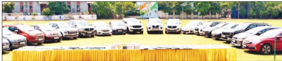
आरोपियों से 19 लजरी कारें हुई बरामद

इसके बाद पीड़ित को गलत सूचना दी जाती कि उसके बैंक खाते की गंभीर समस्या है और कॉल को संबंधित बैंक प्रतिनिधि से जोड़ दिया जाएगा। इसके बाद कॉल को क्लोजर टीम के पास ट्रांसफर किया जाता था, जो स्वयं को बैंक अधिकारी बताकर पीड़ित को यह विश्वास दिलाता था कि उसके खाते में जमा धन सुरक्षित नहीं है। इसके बाद पीड़ित को विभिन्न तरीकों से धन हस्तांतरित करने या सौंपने के लिए प्रेरित किया जाता था, जिनमें घर से कैश पिकअप, घर से सोना खरीदकर पिकअप, अमेजन/एप्पल जैसे गिफ्ट कार्ड खरीदकर उनकी जानकारी साझा करना और विदेशी खातों में वायर ट्रांसफर के माध्यम से धन भेजना शामिल थे।