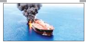
पेज 12 ओमान के पास ड्रोन हमले के बाद भारतीय मालवाहक...