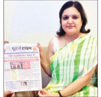
एचवीएम ग्लोबल स्कूल