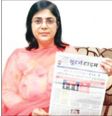
एचवीएम स्कूल, सुभाष नगर