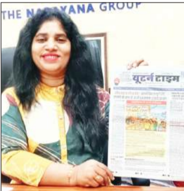
नारायणा स्कूल, जालंधर बाईपास