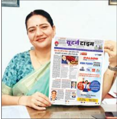
टैगोर पब्लिक स्कूल

लुधियाना/यूटर्न/12 मई। शिक्षा के क्षेत्र में उत्कृष्ट प्रदर्शन करने वाले विद्यार्थियों को सम्मानित करने के उद्देश्य से ह्यूहाई फ्लायर्स अवॉर्ड्स 2026 का भव्य आयोजन किया जा रहा है। यह विशेष समारोह 10वीं और 12वीं कक्षा के उन मेधावी छात्रों को समर्पित है जिन्होंने अपनी मेहनत, अनुशासन और उत्कृष्ट परिणामों से विद्यालय और क्षेत्र का नाम रोशन किया है। यह आयोजन न केवल एक पुरस्कार समारोह है, बल्कि एक प्रेरणादायक मंच है जहाँ विद्यार्थियों की उपलब्धियों को सराहा जाता है और उन्हें भविष्य में और बेहतर करने के लिए प्रोत्साहित किया जाता है। इसमें विभिन्न बोर्डों सीबीएसई, आईएससीई और पंजाब बोर्ड के टॉप प्रदर्शन करने वाले छात्रों को सम्मानित किया जाएगा। इस आयोजन की शुरुआत पिछले वर्ष की गई थी, जिसमें 250 से अधिक मेधावी छात्र और 30 प्रधानाचार्य शामिल हुए थे। 800 से अधिक गणमान्य अतिथियों की उपस्थिति ने इस कार्यक्रम को एक यादगार सफलता बनाया था। उसी परंपरा को आगे बढ़ाते हुए