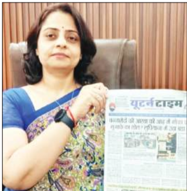
श्री शालिग राम जैन पब्लिक स्कूल