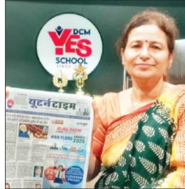
डीसीएम यस स्कूल