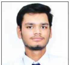
आरएस मॉडल स्कूल के नतीजे भी रहे शानदार