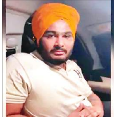
हत्यारे ने वीडियो डाल ली जिम्मेदारी