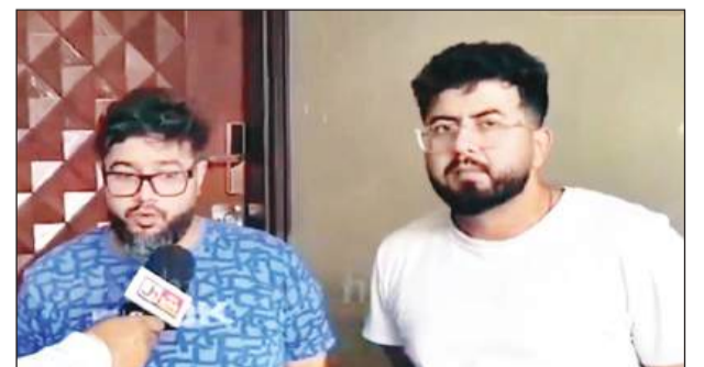
मामले की जानकारी देते हुए पीड़ित

और उच्च अधिकारी मौके पर पहुंचे। पुलिस ने घटनास्थल से गोलियों के खोल कब्जे में ले