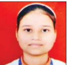
आरएस मॉडल स्कूल के नतीजे भी रहे शानदार