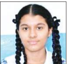
आरएस मॉडल स्कूल के नतीजे भी रहे शानदार