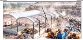
पेज 12 डड्डुमाजरा डडडिंग ग्राउंड पर लगातार बढ़ रहा खर्च...