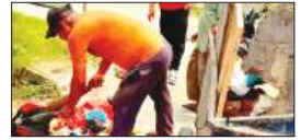
पेज 12 चुनावी स्टंट या जनसेवा? हड़ताल के बीच वार्ड-15...