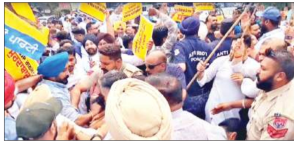
लुधियाना में आपस में भिड़े आप-भाजपा वर्कर