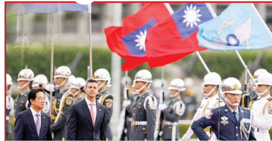
ताइवान की राजधानी ताइपे में राष्ट्रपति लाई चिंग इन पराग्वे के राष्ट्रपति सेंटियागो पेना के स्वागत समारोह में उनके साथ चलते हुए।