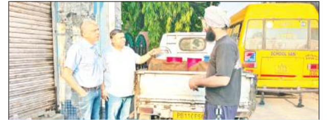
नाका लगाकर दूध के सैंपल लेते हुए स्वास्थ्य विभाग की टीम

जानकारी देते हुए जिला स्वास्थ्य अधिकारी ने बताया कि राज्य-स्तरीय अभियान के तहत टीम द्वारा शहर के विभिन्न प्रवेश बिंदुओं पर नाके लगाकर दूध की आपूर्ति की गहन जांच की गई। उन्होंने बताया कि सुबह की जांच