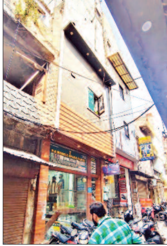
पुरानी कोतवाली एरिया में बनी 6 मंजिला अवैध इमारत

लुधियाना/यूटर्न/3 मई। लुधियाना के वॉर्ड 90 स्थित गुडमंडी नजदीक पुरानी कोतवाली एरिया में पीएस मोबाइल स्पेयर पॉट्स शोरूम की बेसमेंट समेत छह मंजिला अवैध इमारत पर दो महीने बाद भी नगर निगम जोन-ए की बिल्डिंग ब्रांच एक्शन नहीं ले सकी। वहीं उक्त शोरूम के सामने बनी तीन मंजिला इमारत सील कर डाली। सीनियर डिप्टी मेयर राकेश पराशर और उच्च अधिकारियों के आदेशों के बावजूद कार्रवाई न होने पर बिल्डिंग ब्रांच के इस दोहरे चेहरे को लेकर शहर में चर्चाएं छिड़ चुकी हैं। चर्चा है कि अफसरों द्वारा आपसी मिलीभगत के बाद ही पहले निर्माण कराया गया और अब बचाया जा रहा है। इस मामले में कई बिचौलिए भी पैदा हो चुके हैं। जिनकी ओर से लगातार उक्त शोरूम के बचाव के लिए जोरो शोरो से प्रयाल किए जा रहे हैं। चर्चा है कि एक बाहुबली बिचौलिए द्वारा एक नेता का नाम लेकर अधिकारियों और शोरूम मालिक में समझौता कराया गया है। इसी कारण अधिकारी एक्शन नहीं ले रहे। हालांकि उक्त नेता को इसकी जानकारी ही नहीं है। उक्त बिचौलिए का खुद का पुरानी कोतवाली एरिया में पिछली तरफ भगवान के नाम वाला मोबाइल असेंसरी का शोरूम है। वह भी अवैध निर्माण करके बनाया गया है। जिस पर निगम एक्शन भी ले चुका है। लेकिन अब वे एक नेता की शरण में हैं।