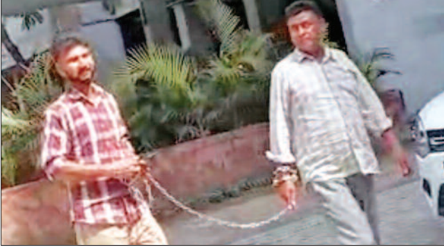
आरोपी को कोर्ट पेश करने ले जाती पुलिस

विजिलेंस, एसडीएम, एसपी और एफएसएल रिपोर्ट के बावजूद 13 साल बाद मिला इंसाफ