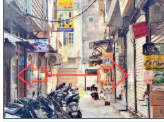
आमने सामने दो अवैध इमारतें, एक खुली, दूसरी सील