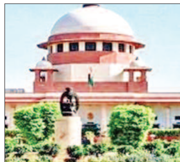
अब यूटी प्रशासन ने इसी फैसले को सुप्रीम कोर्ट

पिछले वर्ष पंजाब एंड हरियाणा हाई कोर्ट ने इस मामले में बड़ी राहत देते हुए संबंधित नेताओं के खिलाफ दर्ज एफआईआर को रद्द कर दिया था।