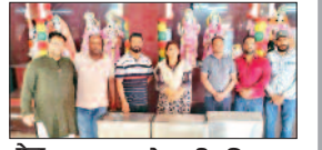
पेज 06 बलदाना के प्राचीन शिव मंदिर में नई कमेटी सक्रिय...