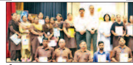
पेज 06 बीवीएम, यूएसएन में उत्साह पूर्वक मनाया गया...