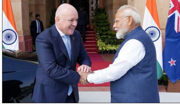
क्रिस्टोफर लक्सन ने सोशल मीडिया प्लेटफॉर्म एक्स पर लिखा, 'एक साल

से थोड़ा ज्यादा समय पहले, मैं भारत में प्रधानमंत्री मोदी से मिला था। तब हम इस बात पर सहमत हुए थे कि हम एक मुक्त व्यापार समझौते पर बातचीत शुरू करेंगे। दशकों तक, कई लोगों ने कहा कि ऐसा नहीं हो सकता। लेकिन आज रात, उस डील पर साइन होने वाले हैं।