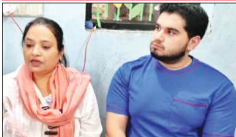
मामले की जानकारी देते हुए महिला