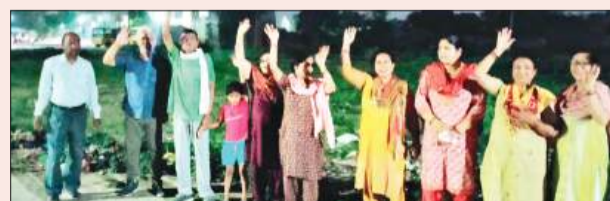
होकर प्रशासन से इस योजना पर विरोध कर रहे निवासियों का पुनर्विचार करने की मांग की है।

जीरकपुर/यूटर्न/25 अप्रैल। एयर फोर्स सोसाइटी के पीछे खाली पड़ी सरकारी जमीन पर शमशान घाट बनाने के प्रस्ताव का स्थानीय निवासियों ने कड़ा विरोध जताया है। क्षेत्र की विभिन्न सोसाइटियों और एयर फोर्स सोसाइटी के लोगों ने एकजुट