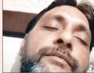
कारोबारी ने मरने से पहले ये वीडियो बनाया।