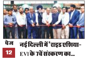
पेज नई दिल्ली में 'राइड एशिया-12' एवी के 7वें संस्करण का...