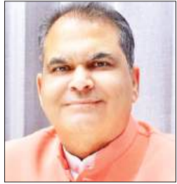
मंत्री संजीव अरोड़ा