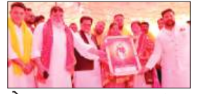
पेज 06 भगवान परशुराम जयंती पर निकाली गई विशाल ...