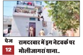
पेज 12 रामदरबार में इग नेटवर्क पर मौलीजागरां थाना..