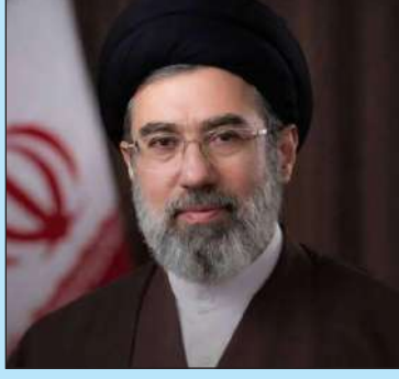
वरिष्ठ अधिकारी मोहसेन रेजाई को सैन्य सलाहकार नियुक्त किया था। उन्होंने तंज कसते

इस्लामाबाद में ईरान के साथ वार्ता असफल होने के बाद अमेरिका ने अरब और ओमान की खाड़ी में ईरानी बंदरगाह से आने और जाने वाले सभी देशों के जहाजों पर नाकाबंदी लगा दी है। अमेरिकी नौसेना के जहाज ओमान की खाड़ी में गश्त कर रहे हैं इस बीच ईरान के सर्वोच्च नेता मोजतबा खामेनेई के सैन्य सलाहकार मोहसेन रेजाई ने धमकी दी है कि अगर अमेरिका होर्मुज जलडमरूमध्य की नाकाबंदी करने का फैसला करता है तो हम अमेरिकी जहाजों को डुबो देंगे। पिछले महीने मोजतबा खामेनेई ने ईरान के