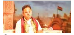
पेज 06 चंडीगढ़ में बरसाना प्रकट उत्सव का पावन और...