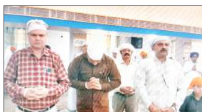
आयोजन के दौरान वातावरण भक्तिमय बना रहा। पाठ की समाप्ति के उपरांत श्री रामलीला एवं

मोहाली/यूटर्न/12 अप्रैल। वैसाखी पर्व के उपलक्ष्य में श्री सुखमनी साहिब के पावन पाठ का आयोजन श्रद्धा एवं भक्ति भाव के साथ किया गया। कार्यक्रम का आयोजन श्री रामलीला एवं दशहरा कमेटी फेस 1 मोहाली की ओर से किया गया। कार्यक्रम प्रातः 10 बजे से दोपहर 12 बजे तक आयोजित हुआ, जिसमें बड़ी संख्या में श्रद्धालुओं ने भाग लेकर गुरबाणी का श्रवण किया और आध्यात्मिक शांति प्राप्त की। पूरे