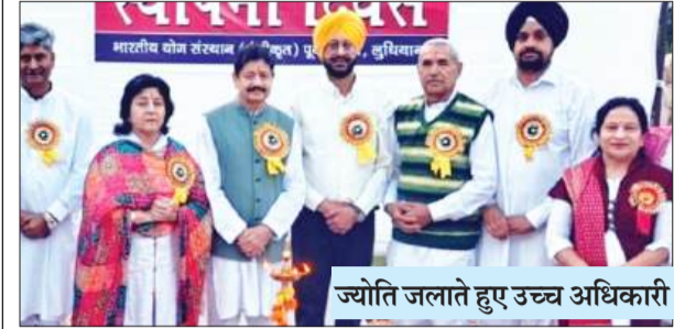
ज्योति जलाते हुए उच्च अधिकारी