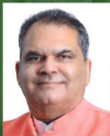
Hon'ble Sh. Sanjeev Arora Cabinet Minister, Govt. of Punjab