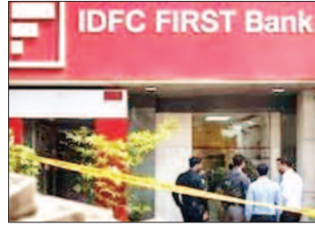
बैंक खातों में अवैध रूप से ट्रांसफर करने

सरकारी विभागों के फंड इस घोटाले में शामिल हैं। फिलहाल, राज्य सतर्कता और भ्रष्टाचार निरोधक ब्यूरो (SV&ACB) इस मामले की जांच कर रहा है, और अब तक 15 लोगों को गिरफ्तार किया जा चुका है। लगभग एक दर्जन खातों में से, दस IDFC First Bank में थे और दो AU Small Finance Bank में थे। जांच में पता चला कि मुख्य आरोपी ने सरकारी फंड को कई