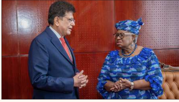
परडब्ल्यूटीओ की महासचिव डॉ. महत्वपूर्ण चर्चा की। सोशल साइट एनोजी ओकोजो-इवियाला के साथ एक्स पर पोस्ट में उन्होंने कहा, 'मैंने

केंद्रीय वाणिज्य और उद्योग मंत्री पीयूष गोयल ने संतुलित और उत्तरदायी विश्व व्यापार संगठन (डब्ल्यूटीओ) के महत्व पर जोर दिया, जो सभी सदस्य देशों, विशेष रूप से विकासशील देशों और सबसे कम विकसित देशों की आवश्यकताओं और आकांक्षाओं को प्रभावी ढंग से पूरा कर सके। पीयूष गोयल ने कैमरोन के यॉन्डे में आयोजित 14वां डब्ल्यूटीओ मंत्रिस्तरीय सम्मेलन (एमसी 14) के अवसर