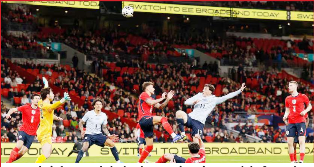
लंदन में मैत्री मुकाबले में खेलते हुए इंग्लैंड और उरुगवे के खिलाड़ी।