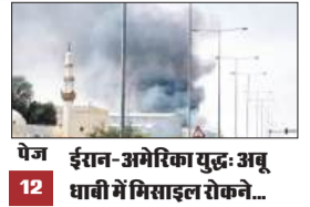
पेज 12 ईरान-अमेरिका युद्ध: अबु धाबी में गिआइल रोकने...