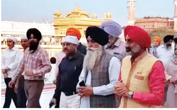
हरमंदिर साहिब के इतिहास, इसकी स्थापना और सिख धर्म की मूल शिक्षाओं के बारे में विस्तार से जानकारी दी। दर्शन के दौरान