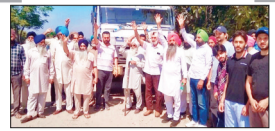
पेज 12 अमलाला में अवैध माइनिंग के खिलाफ मड़का...