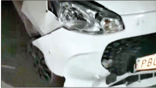
काफी ज्यादा हुआ। बाइक से भिड़ंत के बाद कार अनियंत्रित होकर सड़क किनारे जा टकराई, जिससे गाड़ी का अगला हिस्सा पूरी तरह क्षतिग्रस्त हो गया। हादसे के समय कार में एक परिवार सवार था। घायल युवती के पिता ने बताया कि उनकी बेटी को

जालंधर/यूटर्न/25 मार्च। जालंधर के काला सिंघा रोड पर एक भीषण सड़क हादसे में आल्टो कार और बाइक की जोरदार टक्कर हो गई। टक्कर इतनी जबरदस्त थी कि कार के परखच्चे उड़ गए और उसका एक टायर निकलकर दूर जा गिरा। हादसे में कार सवार एक युवती गंभीर रूप से घायल हो गई, जिसे तुरंत पास के निजी अस्पताल में भर्ती कराया गया, जहां उसका इलाज जारी है। प्रत्यक्षदर्शियों के अनुसार, कार तेज रफ्तार में थी, जिसके चलते टक्कर का प्रभाव