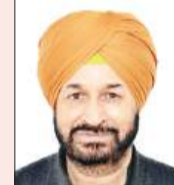
जानता को खराब कर रहे हैं।

तीन देशों के युद्ध के बाद जिला प्रशासन द्वारा लगातार आदेश जारी किए जा रहे हैं। जिसमें एजेंसी मालिकों को भी ग्राहकों को दिक्कत न आने की बात कही जा रही है। लेकिन जमीनी सत्र पर आदेशों का असर देखने को नहीं मिल रहा। एजेंसी मालिक तो कालाबाजारी कर ही रहे हैं, उसके अलावा डिलिवरी बाँध भी जमकर इसका फायदा उठा रहे हैं।