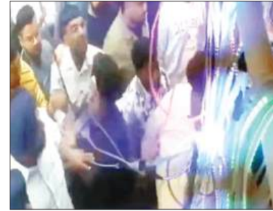
आपस में झगड़ते दुकानदार

लुधियाना/यूटर्न/21 मार्च। बाजार में रेहड़ी लगवाने को लेकर किताब बाजार और बिजली मार्केट के दुकानदार आपस में भिड़ गए। इस दौरान जमकर एक दूसरे के थप्पड़ मारे गए। वहीं दोनों पक्ष ने एक दूसरे पर हथियारों से हमला करने के भी आरोप लगाए। इस पूरी वारदात की एक वीडियो भी सामने आई है। जिसे एक व्यक्ति द्वारा अपने मोबाइल में कैद किया गया था। दोनों पक्ष द्वारा एक दूसरे पर बदमाशी करने, रेहड़ियां लगवाकर अवैध वसूली करने और पैसे न देने पर रेहड़ियां हटवाने के आरोप लगाए गए। जिसके बाद दोनों पक्ष द्वारा सिविल अस्पताल से मेडिकल करवाकर थाना कोतवाली पुलिस को शिकायत दे दी गई है। पुलिस मामले की जांच कर रही है। हालांकि यह मारपीट की वीडियो तेजी से सोशल मीडिया पर वायरल हो रही है।