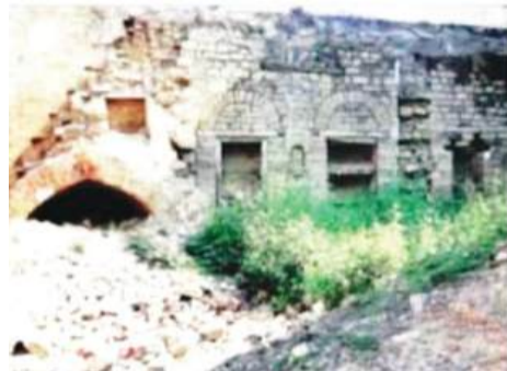
खंडहर बना हुआ पुराना घर (दाएं) यह वह टिल्ला जब कोई जुर्म करता था जिसे उस समय की हुकूमत की ओर से फांसी की सजा दी जाती थी तो उसे इस टिल्ले पर ले जाकर धक्का देकर फेंक दिया जाता था।

गांव में 25 बैड का अस्पताल तो है जिसमें स्टाफ के लिए 8 क्वार्टर और डाक्टरों के लिए 2 आलीशान कोठियां (घर) हैं परन्तु अस्पताल में कोई डाक्टर और न ही स्टाफ है सिर्फ एक डाक्टर सप्ताह में 2-3 बार आता है गांव में बिजली का 66 के. वी. सब स्टेशन है। यहां पर रेलगाड़ी जो पहले दिन में 3 बार आती जाती थी अभी पिछले समय से बिल्कुल बंद है जब के रेल सेवा शुरू होने उपरांत अगर इस लाइन को नंगल से जोड़ दिया जाए तो पंजाब और हिमाचल