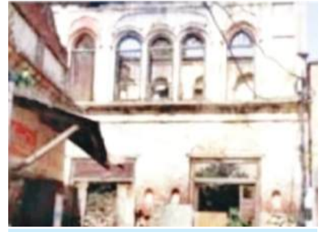
खंडहर बनी किसी समय की आलीशान कोठी, खतरा बनी सीधी खड़ी इमारत।