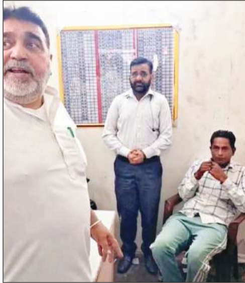
सट्टे की दुकान पर रेड करते विधायक पप्पी

बीजेपी नेता देबी ने कहा - लेबर पर एक्शन, मलाई खाने वाले मालिकों का हो रहा बचाव