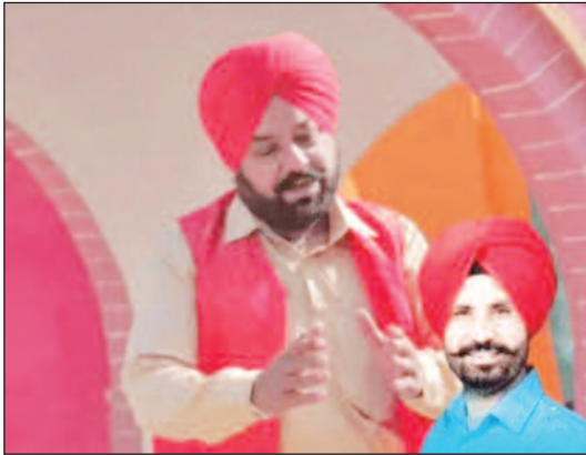
ज्यादा दारु पीने पर भी कभी भाभी को साली नहीं कहता, खा पीके भी 12 पांजे 48 नहीं कहता।