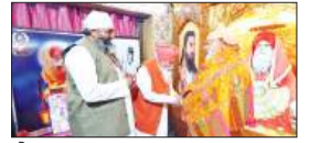
पेज 08 पीएम मोदी ने उद्घाटन समारोह में आदमपुर...