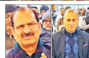
को हरने वाला है।

संसार में तीन प्रकार के ताप दुख माने गए हैं: दैहिक शारीरिक, दैविक प्राकृतिक और भौतिक सांसारिक। राम नाम इन तीनों दुखों