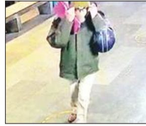
सीटीयू कैश/बॉक्स ब्रांच, ISBT-17 से करीब ₹13,13,710 रुपये की चोरी की सूचना मिली थी। आरोपियों ने रात करीब 3 बजे पुलिस अधिकारी बनकर शाखा में प्रवेश किया।