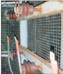
न्यू हाई स्कूल का काटा गया कनेक्शन