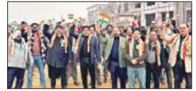
फेज ब्लेसिंग लक्सुरिया में भव्य गणतंत्र दिवस ध्वजा...